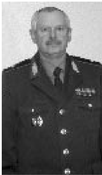
Меня, как военного человека, служба в вооруженных силах научила

разбираться в людях. Я всегда оцениваю человека не только по его словам, но в большей степени по его отношению к выполнению обязанностей, по его конкретным делам и поступкам.